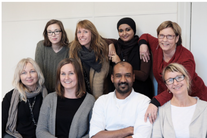
Bosettingsteamet i Fredrikstad.

Fredrikstad kommune er ansvarlig for dette eksemplet.